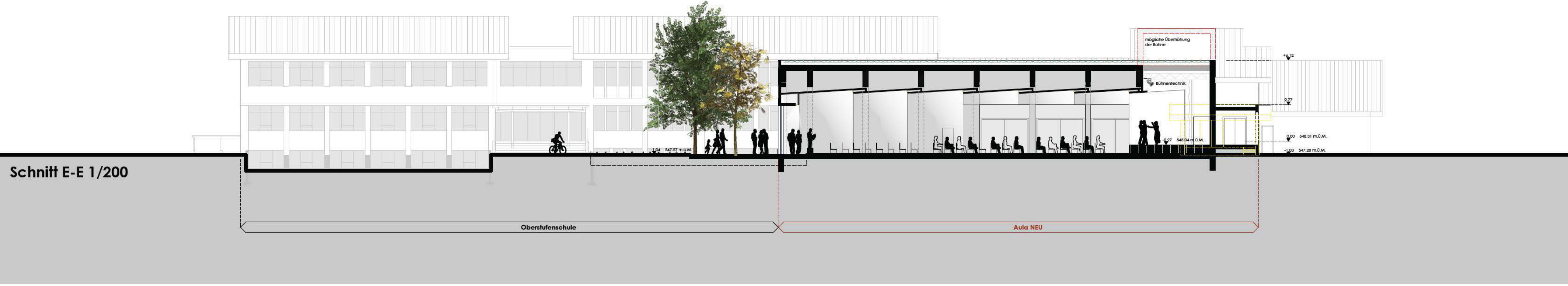
Schnitt E-E 1/200