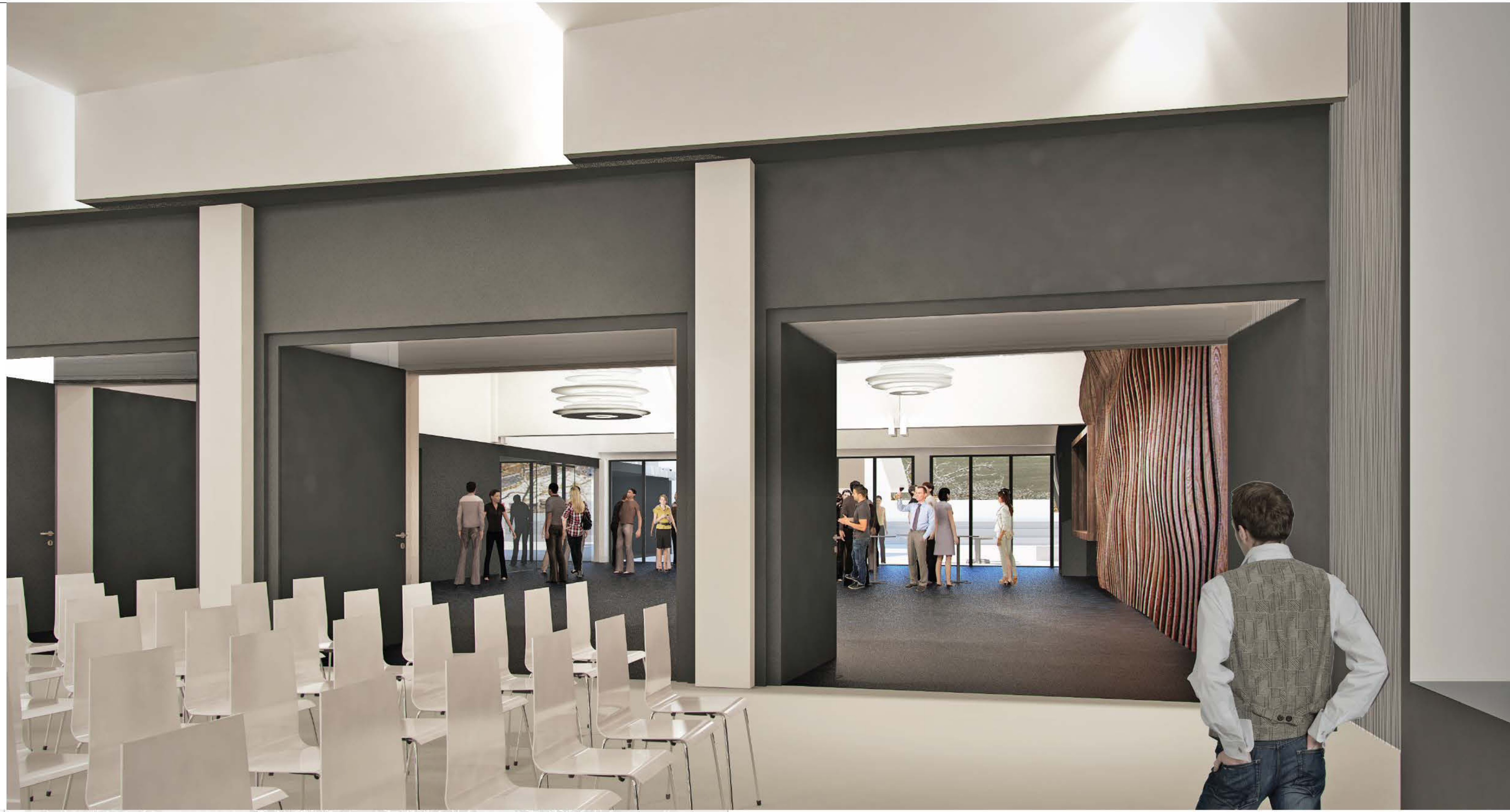
Blick aus der Aula zum Foyer